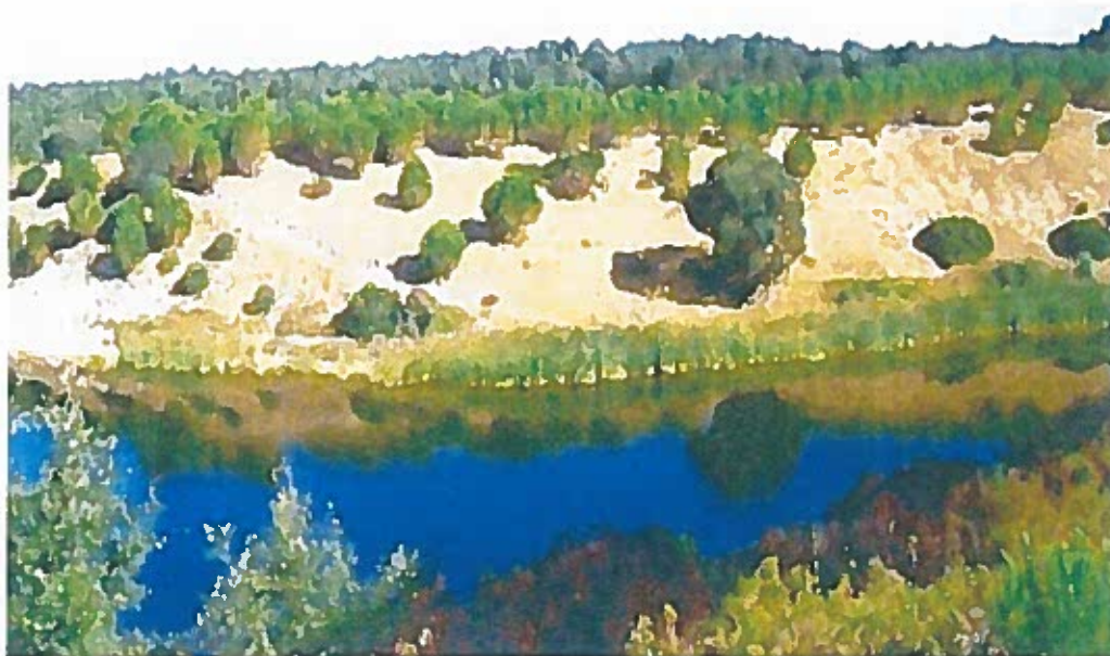
(Herdade de Vale das Reis – Alcácer do Sal)