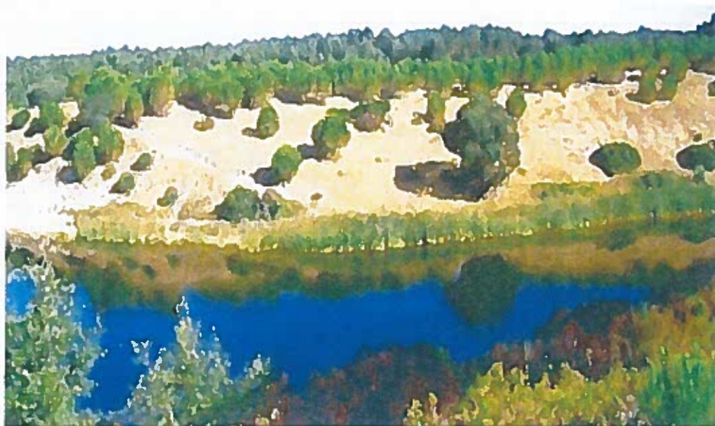
(Herdade de Vale dos Reis – Alcácer do Sal)